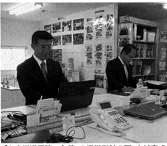
「お客様満足第一主義」の経営指針の下、人材育成に注力している(本社内の様子)

東海エリアで展開している。本社のほか、愛知県と静岡県に各2カ所の営業拠点を持つ。700社の顧客を抱え、電話、複合機、サーバーなどオフィスインフラ整備には欠かせない各種機器の販売やアフターサービスのほ